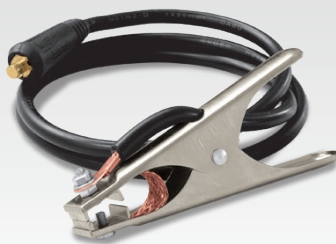
кабель массы 1.5м