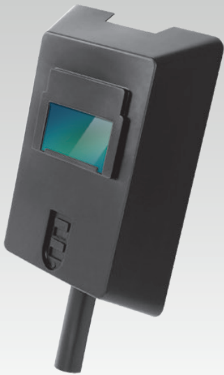
ручной щиток атемнение