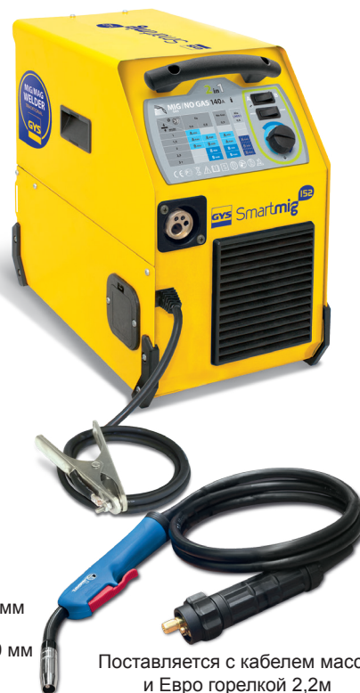
Поставляется с кабелем массы и Евро горелкой 2,2м

Вентилятор с постоянной скоростью защищает от перегрева.