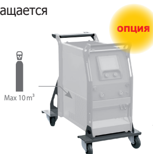
Тележка ref. 040960

Режим Easy или режим PRO для полного доступа к выбору параметров.